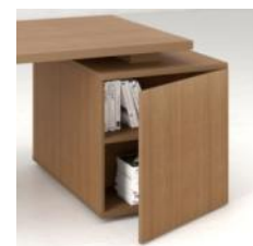
Ниша с дверью в торцевой части тумбы

Тумба имеет три выдвижных ящика, оборудованные центральным замком. Левая боковая сторона тумбы (вид со стороны пользователя) имеет скрытую нишу, оборудованную полкой и дверцей с системой закрывания "push". Торцевая часть тумбы выполнена в виде ниши с полкой, которая может быть укомплектована дверцей, оснащенной системой закрывания "push".