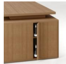
Скрытая ниша с внешней стороны тумбы

С внутренней стороны тумба имеет три одинаковых ниши, в любую из которых можно установить стандартную мобильную тумбу с тремя ящиками (без колёсных опор), сейф, офисный холодильник; остальные две ниши можно комплектовать полками и дверцами, оснащенными системой открывания "push". Внешняя сторона тумбы имеет скрытую нишу, оборудованную полкой и дверцей с системой закрывания "push". Торцевая часть тумбы выполнена в виде ниши с полкой, которая может быть укомплектована дверцей, оснащенной системой закрывания "push".