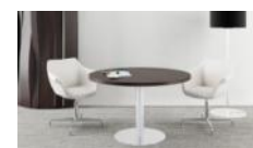
Стол для совещаний с круглой столешницей